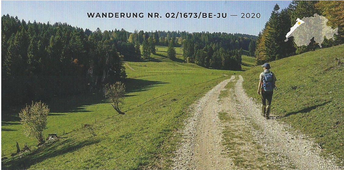
Kurz nach Petit Montcenez durchquert der Wanderweg ein namenloses Tal.